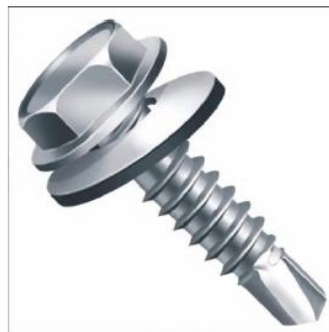
Figura 10: Parafuso autobrocante (imagem ilustrativa)

Kits modulares, permitindo ampliação futura, com dimensionamento segundo cargas de vento em acordo com a norma regulamentadora NBR 6123, dimensionamento da estrutura segundo norma regulamentadora NBR 8800 e tem uma boa relação peso/resistência.