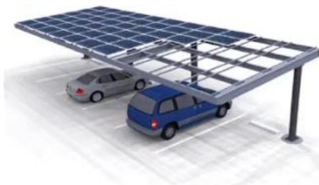
Figura 04: Estrutura carport (imagem ilustrativa)

Associada à geração de energia, a instalação de sistemas em estruturas de garagem tipo Carport propicia vagas de estacionamento cobertas aos usuários do estacionamento de Prédios Públicos, contribuindo para a melhoria da infraestrutura das unidades.