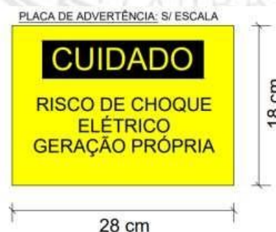
Figura 12: Placa de advertencia (imagem ilustrativa)

Será instalada uma placa de advertência, confeccionada em aço inoxidável ou alumínio anodizado, sendo afixada de forma permanente sobre a caixa de medição/proteção no padrão de entrada, com os seguintes dizeres: “CUIDADO: RISCO DE CHOQUE ELÉTRICO – GERAÇÃO PRÓPRIA”, com gravação indelével, conforme foto abaixo: