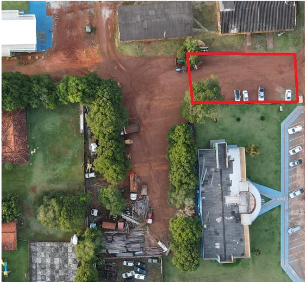
Figura 01: Planta de Situação

O Presente memorial descreve as diretrizes básicas e mínimas que devem ser observadas na execução da obra de implantação de Geração Distribuída ao Sistema de Distribuição Secundário de Energia Elétrica da Concessionária ENERGISA/MT, por meio de microgeração distribuída através da conversão solar fotovoltaica para atender as necessidades de consumo da Prefeitura Municipal de Itaúba/MT, observando as condições gerais de projeto especificação de materiais qualificação técnica mínima, localização da obra, material que deverá ser utilizado, informações para execução da obra, registro junto ao CREA/MT, aprovação junto a ENERGISA, memorial descritivo e segurança a terceiros.